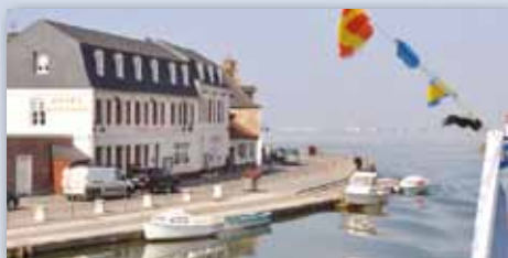
HÔTEL*** DU PORT RESTAURANT DES BAINS