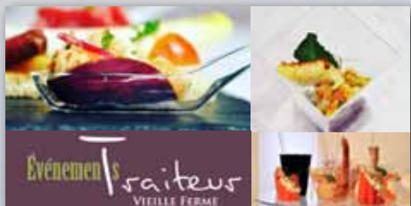
NOTRE SOLUTION POUR DES RÉCEPTIONS RÉUSSIES