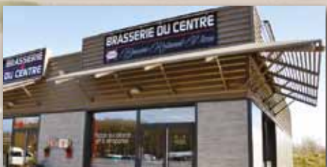
BRASSERIE DU CENTRE