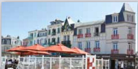
HÔTEL*** BELLEVUE RESTAURANT BEAURIVAGE