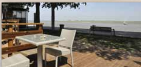
QUAI N°5 Restaurant - Bar à vin et à bière