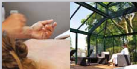
SPA/SOINS ATIMÉRIA Spa de la Vieille Ferme