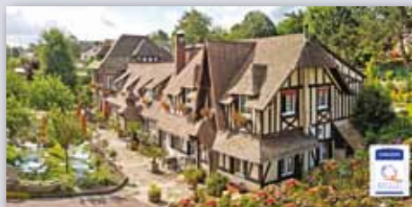
LA VIEILLE FERME*** HÔTEL / SPA / RESTAURANT